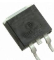
IXFA4N85X IXYS MOSFET N-CH 850V 3.5A TO263-3