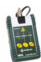
580XL-FC Greenlee Communications LED SOURCE FC CONNECTORS