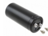
580LSU4700MNB77X191 Rubycon CAP ALUM 4700UF 20% 580V SCREW