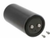
580LSU5600MNB90X191 Rubycon CAP ALUM 5600UF 20% 580V SCREW