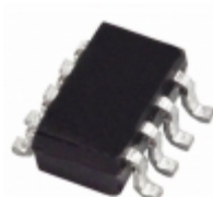
AD5273BRJ1-R2 Analog Devices Inc. IC DGTL POT 1K 64POS SOT23-8