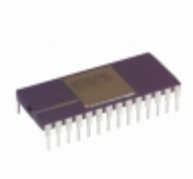
AD667SD Analog Devices Inc. IC DAC 12BIT W/BUFF LATCH 28CDIP