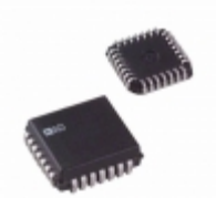
AD667KP-REEL ADI (Analog Devices, Inc.) INTEGRATED CIRCUIT