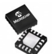
PIC16F18325-I/JQ Microchip Technology IC MCU 8BIT 14KB FLASH 16UQFN