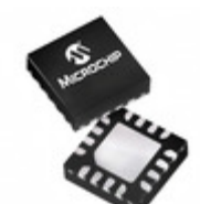
PIC16F18325T-I/JQ Microchip Technology IC MCU 8BIT 14KB FLASH 16UQFN