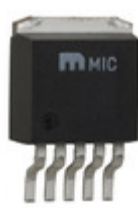
MIC39501-1.8WU-TR Microchip Technology IC REG LDO 1.8V 5A TO263-5