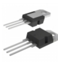
MIC39500-2.5WT Microchip Technology IC REG LDO 2.5V 5A TO220-3