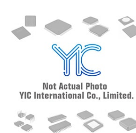
MIC39500-2.5WU TR MICREL MIC39500-2.5WU TR MICREL