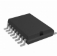
TC4468EOE Micrel / Microchip Technology IC MOSFET DVR QUAD AND 16SOIC