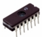
TC4468EJD Micrel / Microchip Technology IC MOSFET DVR QUAD AND 14CDIP