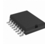
TC4468COE713 Micrel / Microchip Technology IC MOSFET DVR QUAD AND 16SOIC