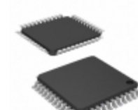
PIC18LC442-I/PT Microchip Technology IC MCU 8BIT 16KB OTP 44TQFP