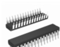
PIC18LC252-I/SP Microchip Technology IC MCU 8BIT 32KB OTP 28SDIP