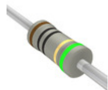
NCR2WSKR-73-910R Yageo RES 910 OHM 2W 10% AXIAL