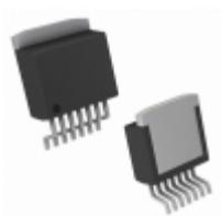
NCV8505D2TADJG ON Semiconductor IC REG LDO ADJ 0.4A D2PAK