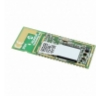
BM64SPKA1MC2-0001AA Microchip Technology RF TXRX MOD BLUETOOTH TRACE ANT