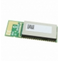
BM64SPKS1MC2-0001AA Microchip Technology RF TXRX MOD BLUETOOTH TRACE ANT