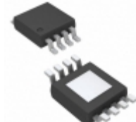
MIC5281-5.0YMME-TR Microchip Technology IC REG LDO 5V 25MA 8MSOP