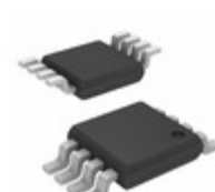
MIC5281YMM-TR Microchip Technology IC REG LDO ADJ 25MA 8MSOP