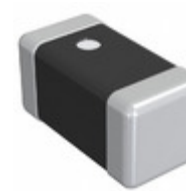
DFE18SAN1R0MG0L Murata Electronics FIXED IND 1UH 1.7A 128 MOHM SMD