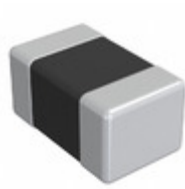
DFE201210S-1R0M=P2 Murata Electronics FIXED IND 1UH 2.3A 70 MOHM SMD