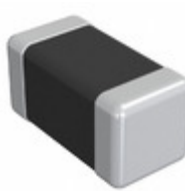
DFE18SANR56ME0L Murata Electronics FIXED IND 560NH 2.2A 84 MOHM SMD