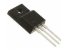
DPG20C300PN IXYS DIODE ARRAY GP 300V 10A TO220FP