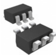
MAX4729EXT+T Maxim Integrated IC SWITCH SPDT SC70-6