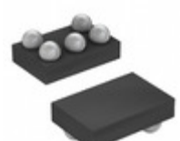
MAX4372HEBT+TG45 Maxim Integrated IC OPAMP CURR SENSE 110KHZ 5UCSP