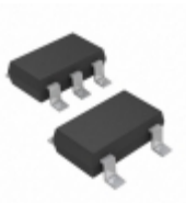
MIC5265-2.85YD5 Microchip Technology IC REG LDO 2.85V 0.15A TSOT23-5