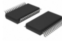
LTC3703EG#TRPBF Linear Technology IC REG CTRLR BUCK 28SSOP