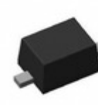
MM3Z3V0B Fairchild/ON Semiconductor DIODE ZENER 3V 200MW SOD323F