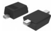
MM3Z3V0C AMI Semiconductor / ON Semiconductor DIODE ZENER 3V 200MW SOD323F