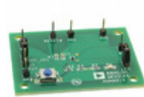
ADM8615-EVALZ ADI (Analog Devices, Inc.) EVAL BOARD FOR ADM8615