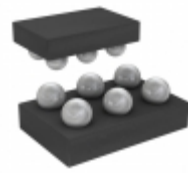
ADM8615Z050ACBZ-R7 Analog Devices Inc. MONITR,RESET,WATCHDOG ULP SUPV C