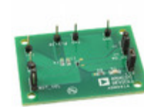
ADM8614-EVALZ ADI (Analog Devices, Inc.) EVAL BOARD FOR ADM8614