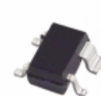
ADM8616LCYAKSZ-RL7 Analog Devices Inc. IC SUPERVISOR WATCHDOG LV SC70-4