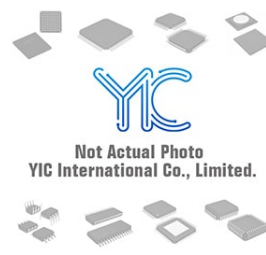
ADM8616 AD ADM8616 AD