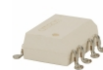
G3VM-402F Omron Electronics Inc-EMC Div RELAY SSR DPST 400VAC 120MA 8SMT