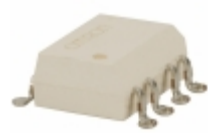
G3VM-402F(TR) Omron Electronics Inc-EMC Div RELAY SSR DPST 120MA 8-SMD