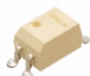
G3VM-41DR Omron Electronics Inc-EMC Div RELAY SSR SPST 2.5A 40V 4-SMD