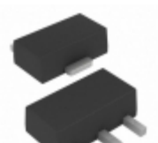
MCP1703AT-2502E/MB Microchip Technology IC REG LDO 2.5V 0.25A SOT89-3