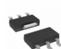
MCP1703AT-1502E/DB Microchip Technology IC REG LDO 1.5V 0.2A SOT223-3