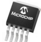
MCP1825-0802E/ET Microchip Technology IC REG LDO 0.8V 0.5A DDPAK