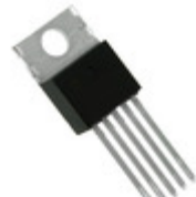
MCP1825-1802E/AT Microchip Technology IC REG LDO 1.8V 0.5A TO220-5