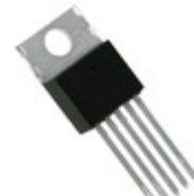
MCP1825-0802E/AT Microchip Technology IC REG LDO 0.8V 0.5A TO220-5