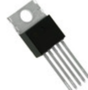
MCP1825-1202E/AT Microchip Technology IC REG LDO 1.2V 0.5A TO220-5