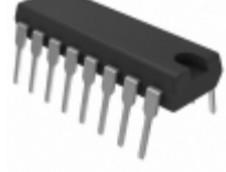
74VHC139N Fairchild/ON Semiconductor DECODER/DEMUX DUAL 2-4 16DIP