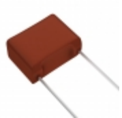
ECW-FA2J394J Panasonic Electronic Components CAP FILM 0.39UF 5% 630VDC RADIAL