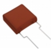
ECW-FA2J274JB Panasonic Electronic Components CAP FILM 0.27UF 5% 630VDC RADIAL