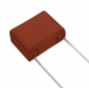
ECW-FA2J334J Panasonic Electronic Components CAP FILM 0.33UF 5% 630VDC RADIAL