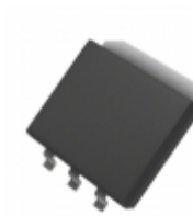
MIC37150BM Microchip Technology IC REG LDO ADJ 1.5A SPAK-3