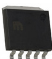
MIC37151-1.65BR Microchip Technology IC REG LDO 1.65V 1.5A SPAK-5