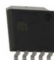
MIC37151-1.5BR Microchip Technology IC REG LDO 1.5V 1.5A SPAK-5