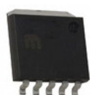
MIC37151-1.65WR Microchip Technology IC REG LDO 1.65V 1.5A SPAK-5