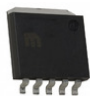
MIC37151-1.5WR Microchip Technology IC REG LDO 1.5V 1.5A SPAK-5