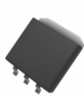
MIC37150-3.3WR-TR Microchip Technology IC REG LDO 3.3V 1.5A SPAK-3