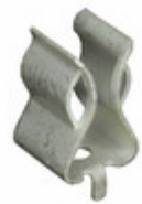
BK/1A3400-10-R Eaton FUSE CLIP CARTRIDGE 30A PCB