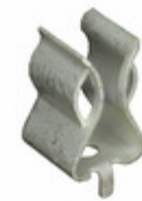
BK/1A3400-11 Eaton FUSE CLIP CARTRIDGE PCB