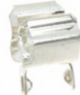
BK/1A3399-10 Eaton FUSE CLIP CARTRIDGE PCB