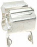
BK/1A3399-12 Eaton FUSE CLIP CARTRIDGE PCB