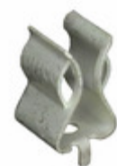
BK/1A3400-09 Eaton FUSE CLIP CARTRIDGE 20A PCB