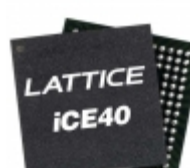
ICE40LM4K-CM36TR1K Lattice Semiconductor Corporation IC FPGA 28 I/O 36UCBGA