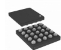
ICE40LM2K-SWG25TR50 Lattice Semiconductor Corporation IC FPGA 18 I/O 25WLCSP