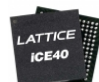
ICE40LM4K-CM36 Lattice Semiconductor Corporation IC FPGA 28 I/O 36UCBGA