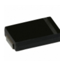
157XMPL002MG19 Illinois Capacitor CAP ALUM POLY 150UF 20% 2V SMD