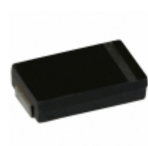
157XMPL004MG19 Illinois Capacitor CAP ALUM POLY 150UF 20% 4V SMD