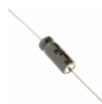
157TTA100M Illinois Capacitor CAP ALUM 150UF 20% 100V AXIAL