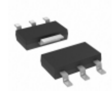
MCP1790-3002E/DB Microchip Technology IC REG LDO 3V 70MA SOT223-3