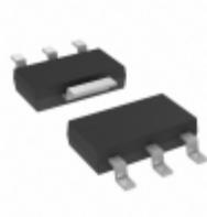
MCP1790-5002E/DB Microchip Technology IC REG LDO 5V 70MA SOT223-3