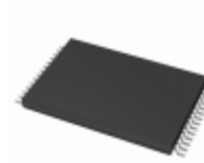
AT29C256-70TC-T Microchip Technology IC FLASH 256KBIT 70NS 28TSSOP