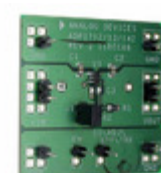
ADP1712-EVALZ ADI (Analog Devices, Inc.) BOARD EVALUATION ADP1712