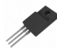
MBRF40200CT SMC Diode Solutions DIODE ARRAY SCHOTTKY 200V ITO220