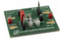
AS1359-TT-30_EK_ST ams BOARD EVAL FOR AS1359-30