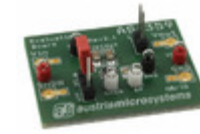
AS1359-TT-28_EK_ST ams BOARD EVAL FOR AS1359-28