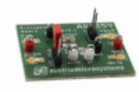
AS1359-TT-31_EK_ST ams BOARD EVAL FOR AS1359-31