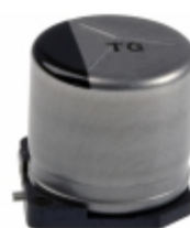
EEV-TG1C221P Panasonic Electronic Components CAP ALUM 220UF 20% 16V SMD