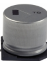
EEV-TG1A472M Panasonic Electronic Components CAP ALUM 4700UF 20% 10V SMD