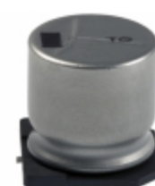
EEV-TG1C222UM Panasonic Electronic Components CAP ALUM 2200UF 20% 16V SMD