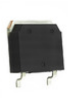
IXTT16P20 IXYS MOSFET P-CH 200V 16A TO-268