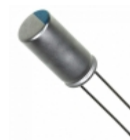
227ULR016MFH Illinois Capacitor CAP ALUM POLY 220UF 20% 16V T/H