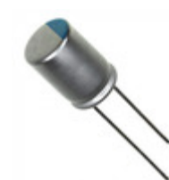
227UER016MFH Illinois Capacitor CAP ALUM POLY 220UF 20% 16V T/H