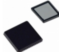
ADUC816BCP Analog Devices Inc. IC MCU 8BIT 8KB FLASH 56LFCSP