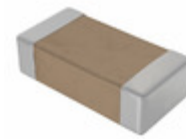
1206SC152KAT2A AVX Corporation CAP CER 1500PF 1.5KV X7R 1206