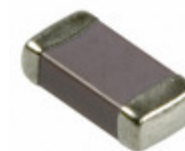
1206SC222KAT9A AVX Corporation CAP CER 2200PF 1.5KV X7R 1206