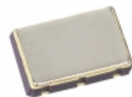
656L98306C2T CTS Electronic Components OSC XO 983.0400MHZ LVDS SMD