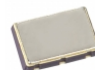
656P10403C2T CTS Electronic Components OSC XO 104.0000MHZ LVPECL SMD