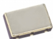
656L98306C3T CTS Electronic Components OSC XO 983.0400MHZ LVDS SMD