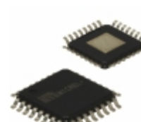
SY87700ALHG-TR Microchip Technology IC CLK DATA REC SDH 208MBPS