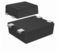
S-80960CLPF-G7WTFG SII Semiconductor Corporation IC VOLT DETECTOR 6.0V SNT-4A