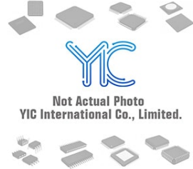
S-80960ANMDJQ-T2 S S SOP-5