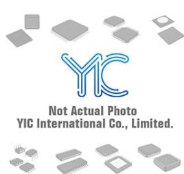
AT24C512-10PU-18 AT- AT- SOP-8