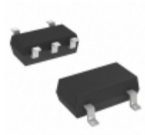
S-80944CLMC-G7ET2G SII Semiconductor Corporation IC VOLT DETECTOR 4.4V SOT23-5