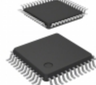
PIC24FJ64GA705T-I/PT Microchip Technology IC MCU 16-BIT 64KB FLASH 48TQFP