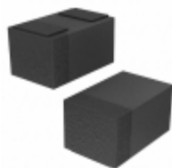
CZRQR52C6V2-HF Comchip Technology DIODE ZENER 6.2V 125MW 0402