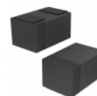
CZRQR52C6V2-HF Comchip Technology DIODE ZENER 6.2V 125MW 0402