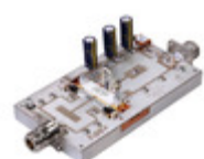
MRF1K50H-TF1 NXP USA Inc. MRF1K50H 87.5-108 MHZ EVAL BOARD