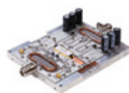
MRF1K50H-TF4 NXP USA Inc. MRF1K50H 230 MHZ EVAL BOARD