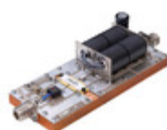
MRF1K50H-TF2 NXP USA Inc. MRF1K50H 27 MHZ EVAL BOARD