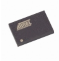
AT45DB041B-CC Microchip Technology IC FLASH 4MBIT 20MHZ 14CBGA