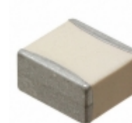
HQCCHA820KA19A AVX Corporation CAP CER 82PF 3KV NP0 2325