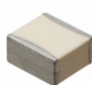
HQCCHA4R7CA19A AVX Corporation CAP CER 4.7PF 3KV NP0 2325