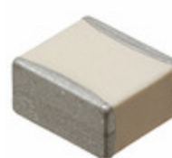
HQCCSA102KAT9A AVX Corporation CAP CER 1000PF 1.5KV NP0 2325