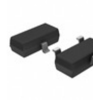
MCP1702T-2802E/CB Microchip Technology IC REG LDO 2.8V 0.25A SOT23A-3